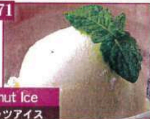
Coconut Ice ココナッツアイス