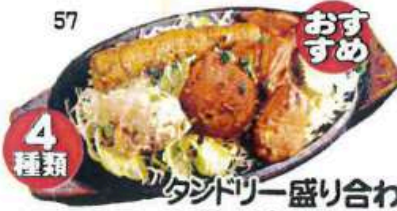
タンドリー盛り合わせ Tandoori Set

4種の盛り合わせ、チキンティッカ2個、レシミカバブ、タンドリーチキン、シークカバブ各1個、 ¥1,300+税