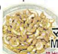
マサラナッツ Masala Nuts