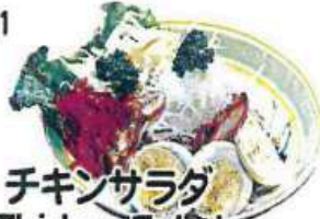
チキンサラダ Chicken Salad