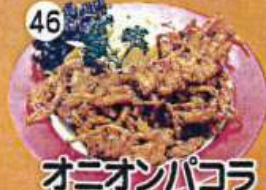
オニオンパコラ Onion Pakoda