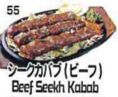
シークカバブ(ビーフ) Beef Seekh Kabab