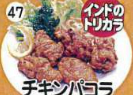
チキンパコラ Chicken Pakoda