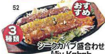
シークカバブ盛り合わせ Mix Kabab