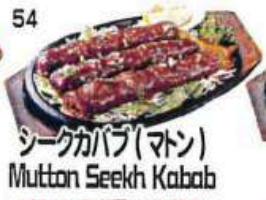
シークカバブ(マトン) Mutton Seekh Kabab