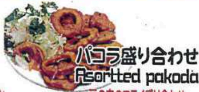
パコラ盛り合わせ Assorted pakoda