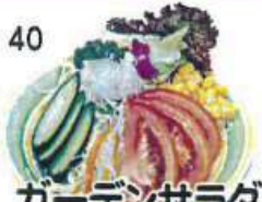
ガーデンサラダ Garden Salad