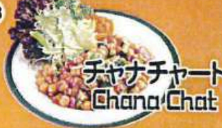
チャナチャート Chana Chat