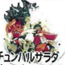
カチュンバルサラダ Kachumber Salad