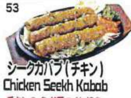
シークカバブ(チキン) Chicken Seekh Kabab