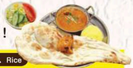
骨なしタンドリーチキン Chicken Tikka