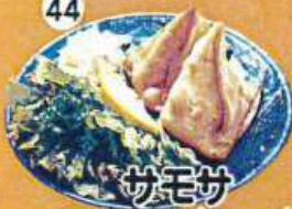
サモサ Samosa (2 pcs)