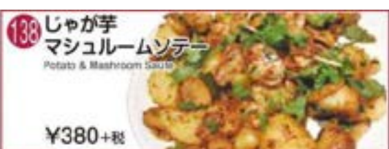
138 ジャガ芋 マッシュルームソテー Potato & Mushroom Saute ¥380+税