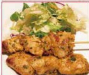
134 ガイサテー 2本 Gai Sate 2pcs ¥380+税