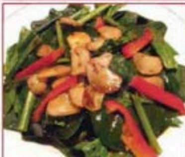
132 ほうれん草のんにく炒め Spinach Saute Garlic Flavor ¥380+税