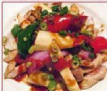
131 鶏とたけのこ炒め Chicken & Bamboo Shoots たけのこの食感がマッチ ¥480+税