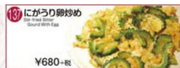
137 にがうり卵炒め Spicy-fried Gitter Gourd With Egg ¥680+税