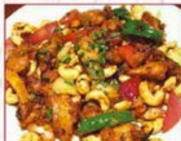
130 チキンカシューナッツ炒め Chicken & Cashewnuts 定番のメニュー! ¥480+税