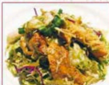
128 スパイシーチキンサラダ Spicy Chicken Salad ¥380+税