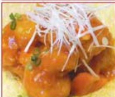
135 エビ・チリ Prawn Chili Sauce ¥780+税