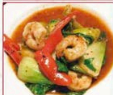
136 エビとチンゲン菜炒め Prawn & Chingensai タイ風甘辛炒め ¥580+税