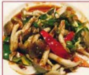
133 鶏としめじのタイ風炒め Chicken & Shimeji Mushrooms コクのあるシェフ自慢の一品 ¥480+税