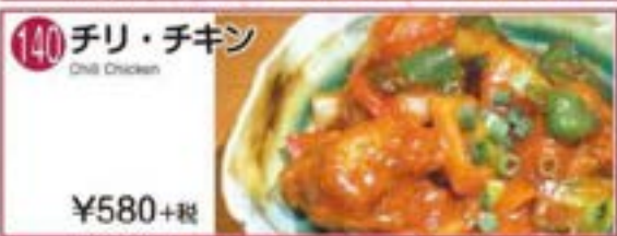
140 チリ・チキン Chili Chicken ¥580+税