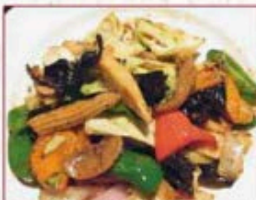
129 タイ風野菜炒め Veg. Saute Thai Style 一味違うオリエンタルな味 ¥480+税