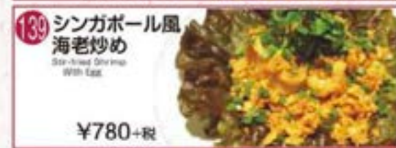
139 シンガポール風 海老炒め Singapore Style Shrimp With Egg ¥780+税